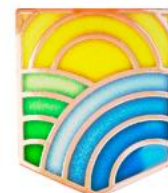
МИНИСТЕРСТВО ТРУДА И СОЦИАЛЬНОЙ ЗАЩИТЫ РФ